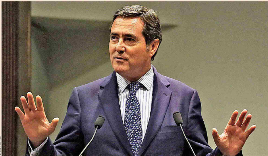
El presidente de CEOE, Antonio Garamendi.

Por su parte, la presidenta de la Comisión Europea, Ursula von der Leyen, es partidaria de potenciar el diálogo con EEUU para buscar una solución a las tensiones por los aranceles, si bien advirtió ayer de que la UE está dispuesta a tomar medidas si no hay acuerdo. Eso sí, prefiere "ir primero a una reunión para abordar las diferencias y ver cómo llegar a una situación en la que todos ganemos", dijo.