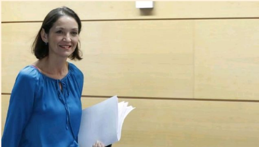
La ministra de Industria, Comercio y Turismo, Reyes Maroto.