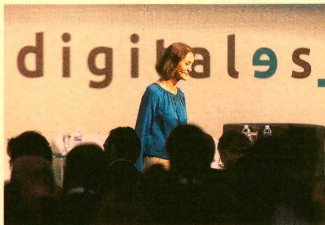
La ministra de Industria, Reyes Maroto, ayer durante su intervención en el Congreso de DigitalES.

Maroto precisó que la elaboración de la hoja de ruta contará con la participación de otros ministerios por el “carácter transversal” de la digitalización, así como con la de agentes sociales y