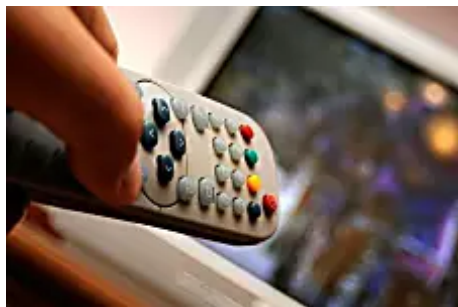
Cuatro canales de la TDT cumplen dos años sin llegar al 1% de audiencia