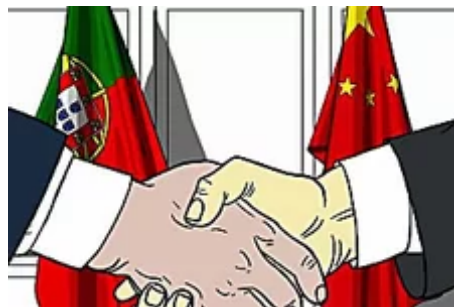
Europa intenta evitar la 'invasión' de China mientras que Portugal abre la puerta de par en par