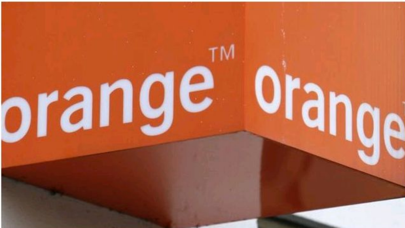
Operadoras alertan de que la carga fiscal resta recursos para la digitalización

El Gobierno ha invitado hoy a las operadoras de telecomunicaciones a participar en la hoja de ruta para la digitalización de la industria y éstas han alertado de que la carga fiscal que soportan les impide invertir más para que España sea "número 1" en revolución digital.