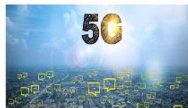
Próximos pasos para la liberación del segundo dividendo digital