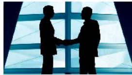
Nueva alianza estratégica de la unidad de seguridad de Telefónica