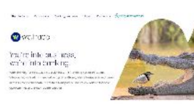
Nueve bancos europeos crean una plataforma blockchain para facilitar los negocios internacionales