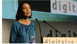
Reyes Maroto anuncia una inversión de 100 millones en digitalización