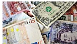
El CDTI concede más de 62 millones a 138 proyectos de I+D+i