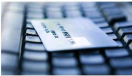
El sur de Europa solo supone el 12% del e-commerce del continente