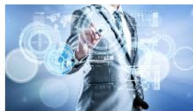
Casi un 4 de cada 10 empresas piensa que carece de capacidades para abordar su digitalización