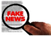
YouTube invertirá 25 millones de dólares para luchar contra las Fake News