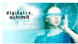
Digitalización, política y economía, en el primer congreso de DigitalES en Madrid