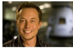
Elon Musk crea una cápsula para rescatar a los niños atrapados en una cueva de Tailandia