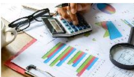
El crecimiento de la Eurozona se desacelerará en 2019, según CEPREDE