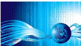
La patronal del sector quiere generar un debate sobre la digitalización y sus oportunidades